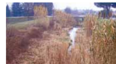
Il Carron prima (sopra) e dopo (sotto) l'intervento di pulitura

Questi interventi sono mirati ad attenuare l'impatto delle acque in caso di piogge eccezionali. Più complessa sarà invece la soluzione di altri nodi che richiederanno interventi strutturali allo studio.