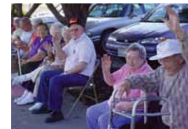
In un incontro pubblico aperto alla popolazione saranno affrontate le questioni emerse dai questionari ed eventuali altri temi.

Torneo di videogiochi, con il fine di riuscire ad agganciare i ragazzi che frequentano le scuole secondarie e poter avere un momento d'incontro in cui rilevare i loro bisogni.